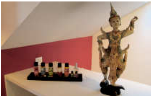
Fernöstlich inspirierte Dekoration

SanuraSPA Bliggenswil, 8494 Bauma Tel. 052 386 35 35, www.sanuraspa.ch