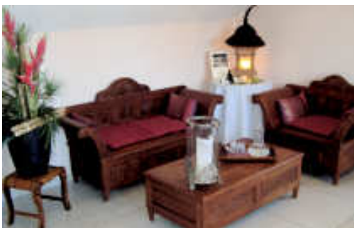
Gemütliches Ambiente im Wartebereich

Auf zwei Stockwerken, bei schönem Wetter sogar unter freiem Himmel, können sich die Kunden im SanuraSPA verwöhnen lassen und den Alltag für ein paar Stunden vergessen – zum Beispiel bei einer „Reise nach Bali“, die mit einem Fussbaderitual beginnt und nach einer traditionellen balinesischen Ganzkörpermassage sowie der Lulur-Körperbehandlung mit einem balinesischen Blütenbad endet.