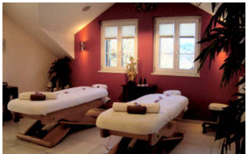
Perfektes Wellness-Ambiente auch im grossen Behandlungsraum