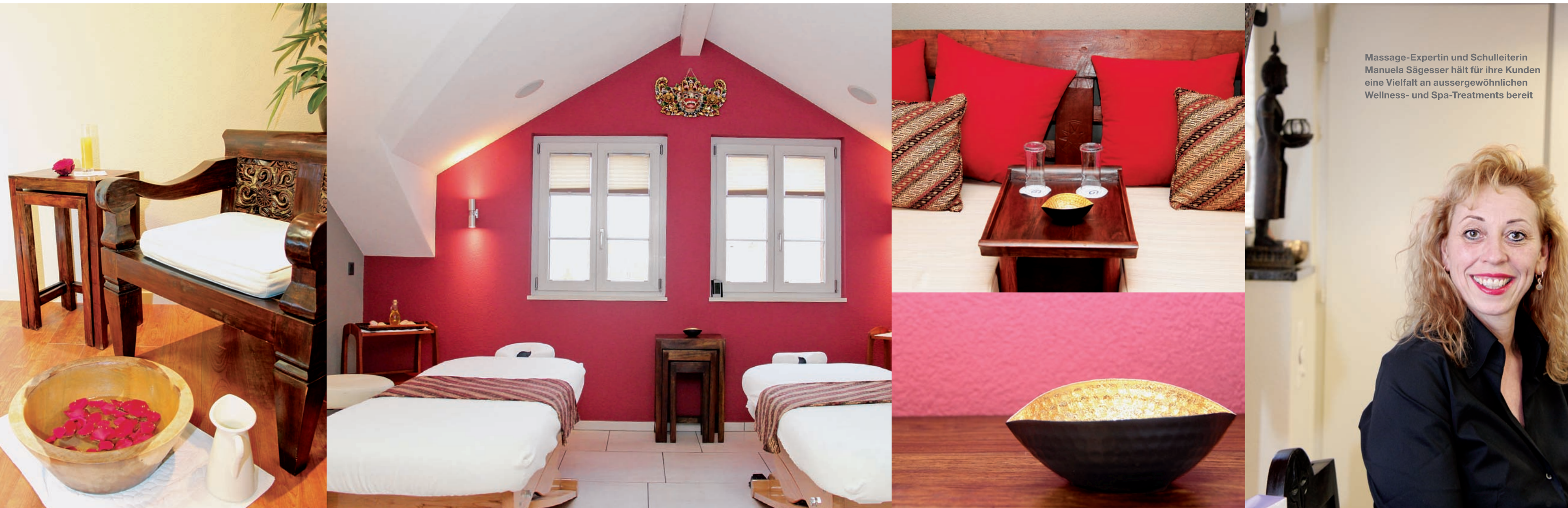
Massage-Expertin und Schulleiterin Manuela Sägger hält für ihre Kunden eine Vielfalt an aussergewöhnlichen Wellness- und Spa-Treatments bereit